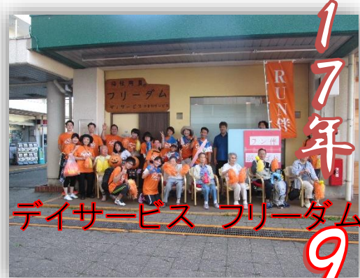
デイサービス フリーダム