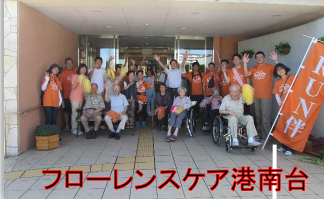
フローレンスケア港南台