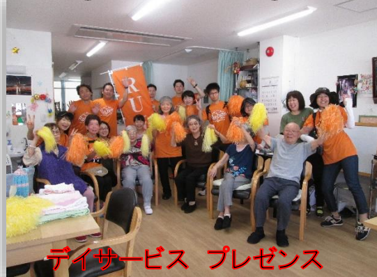
デイサービス プレゼンス