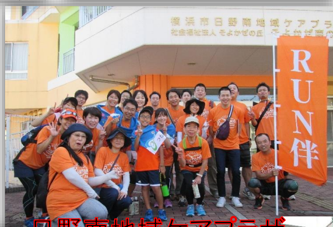
日野南地域ケアプラザ