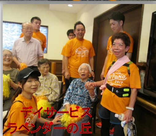
デイサービス ラベンダーの丘