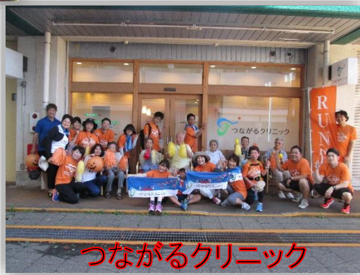
つながるクリニック