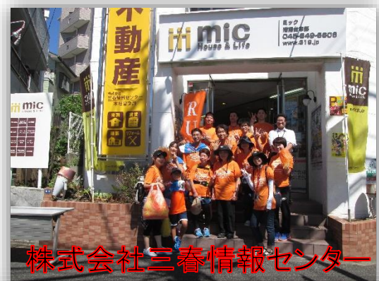
株式会社三春情報センター