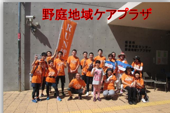
野庭地域ケアプラザ