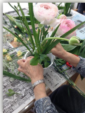
写真は活動の様子です。