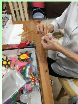
写真は活動の様子です。